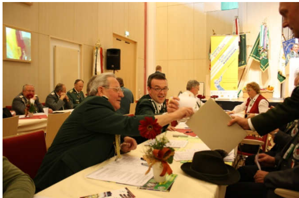
Vertreter aus Mügeln bei der Wahl des neuen Vorstandes des SSB