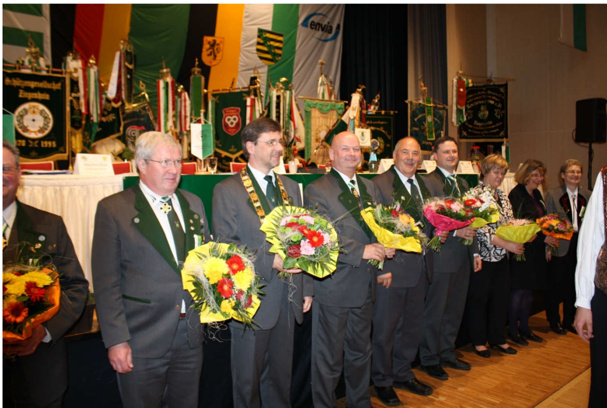
Herzlichen Glückwunsch dem neu gewählten Präsidium des SSB.