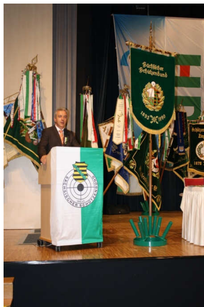
Ministerpräsident Tillich bei der Ansprache der Delegierten