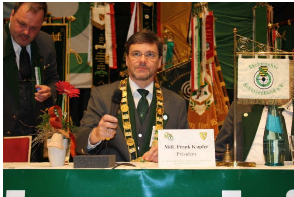
der „alte“ und „neue“ Präsident des SSB