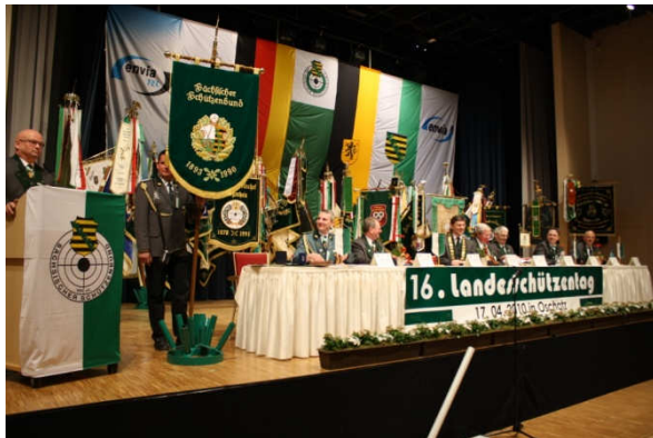
Präsidium des SSB