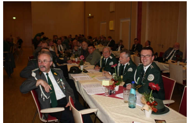
Vertreter des Schützenkreises Torgau-Oschatz