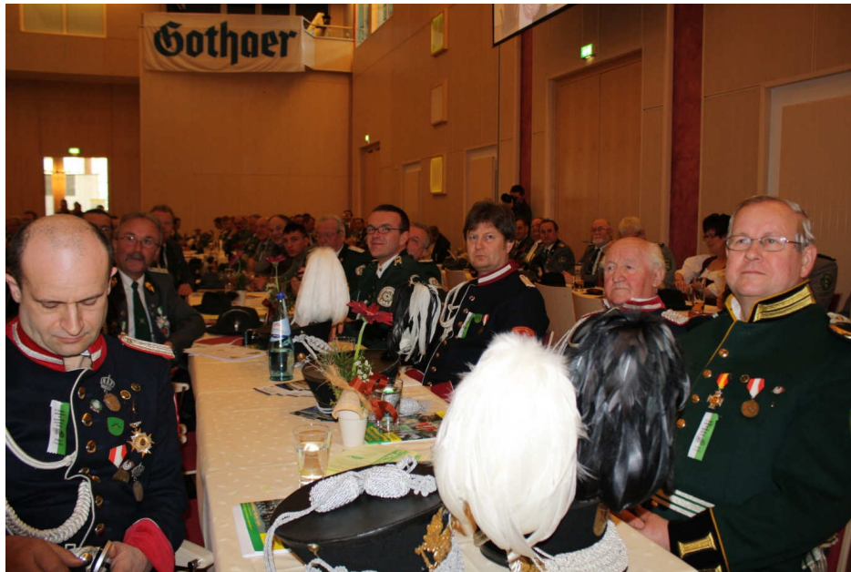
Vertreter des SSK TO aus Belgern, Strehla, Domnitzsch, Mügeln und Neiden